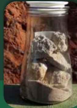
Rachão – Brita 3